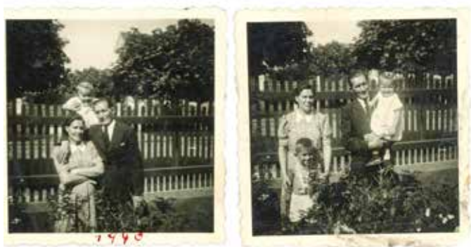
Na zahradě u Varhaničků v r. 1940

Voda se ohřívala v plechovém hrnci na peci. K hygieně patřil samozřejmě i WC. Směli jsme používat záchod v přízemí, se vstupem z kuchyně Varhaničkových. Ve sklepě jsme měli vyhrazený prostor pro uložení brambor.